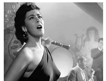
1956 DIEU ME PARDONNE (Dios no io quiera) de Tulio Demicheli