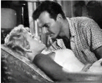
1959 LES FOLIES DE BARBARA (Las locuras de Barbara) de Tulio Demicheli avec Antonio Casal