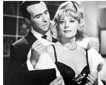
1964 BUENAS NOCHES, AÑO NUEVO de Julian Soler avec Ricardo Montalban