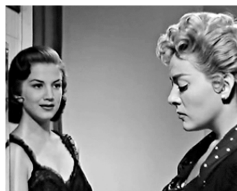
1956 L'ADULTÈRE (La Adultera) de Tulio Demicheli avec Carmen Montejo