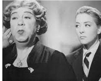
1952 DOÑA MARIQUITA (Doña Mariquita de mi corazón) de et avec Joaquín Pardavé