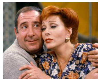
1980 LE CHANT DE LA CIGALE (El Canto de la Cigarra) de José María Forqué avec Alfredo Landa