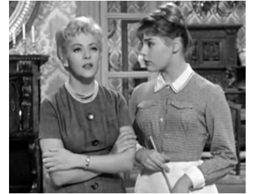
1958 HOMMES ET GENTILHOMMES (Uomini e nobiluomini) de G. Bianchi avec Elke Sommer