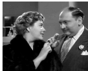
1955 HISTOIRE D'UN MANTEAU DE VISON (Historia de un abrigo de mink) d'E. G. Muriel