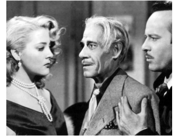
1952 UN RINCÓN CERCA DEL CIELO de Rogelio A. González avec Andrés Soler, Pedro Infante