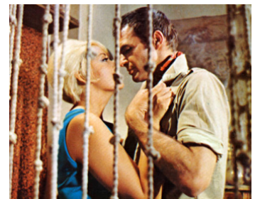
1969 CAINE (Shark I) de Samuel Fuller avec Burt Reynolds