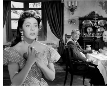
1957 LE REBELLE (Una Cita de Amor) d'Emilio Fernandez avec Jaime Fernandez