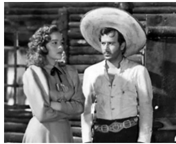
1949 LA MUJER QUE YO PERDI de Roberto Rodriguez avec Pedro Infante