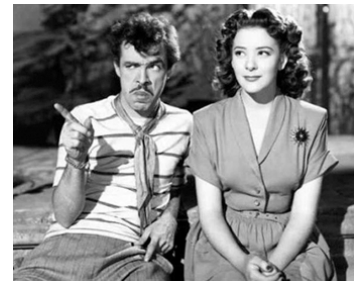
1949 CORDON S'IL VOUS PLAÎT (El Portero) de Miguel M. Delgado avec Cantinflas