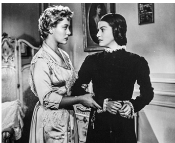
1954 JALOUSIE (La Sospechosa) d'Alberto Gout avec Carmen Montejo