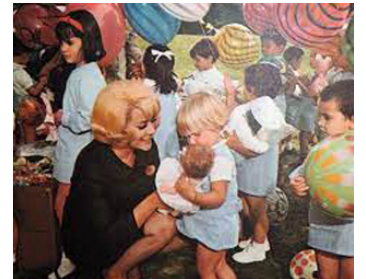
1966 STRATÉGIE MATRIMONIALE (Estrategia matrimonial) d'Alberto Gout