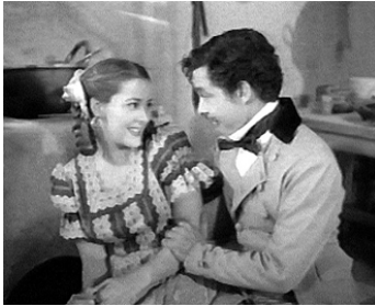
1950 LA MARQUE DE ZORRILLO (La Marca del Zorrillo) de G. Martínez Solares avec R. Valdés