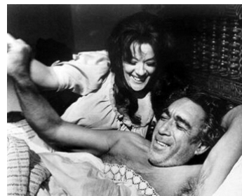
1967 LA BATAILLE DE SAN SEBASTIAN d'Henri Verneuil avec Anthony Quinn