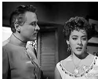
1955 PÉCHÉ MORTEL (Pecado mortal) de Miguel M. Delgado avec Victor Junco