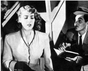
1953 SI... MI VIDA de Fernando Mendez avec Rafael Baledón