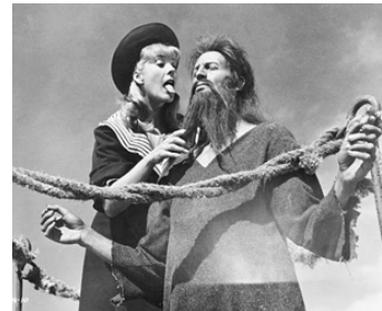
1965 SIMON DU DÉSERT (Simón del desierto) de Luis Buñuel avec David Temling