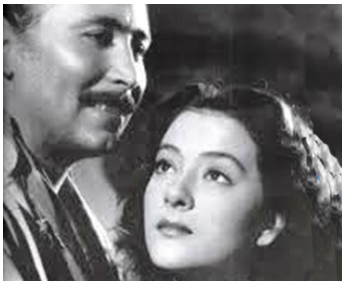
1948 BAMBA (Bamba) de Miguel Contreras Torres avec Tito Junco