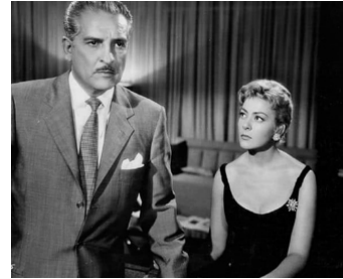
1958 UN HOMME À MON GOÛT (El Hombre que me gusta) de T. Demicheli avec A. de Corbura