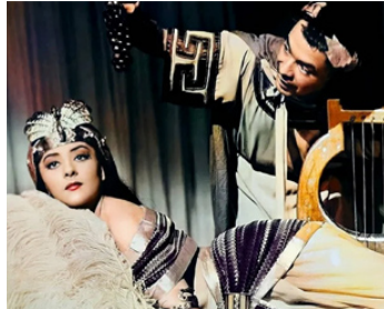
1952 ME TRAES DE UN' ALA de Gilberto Martínez Solares avec German Valdés