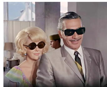
1968 24 HEURES DE PLAISIR (24 horas de placer) de René Cardona Jr avec Mauricio Garcés