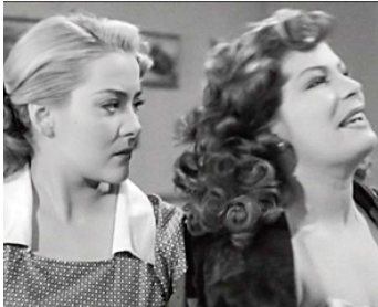
1952 CUANDO LOS HIJOS PECAN de Joselito Rodríguez avec Meche Barba