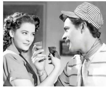
1949 LA CAÍD (El Rey del Barrio) de Gilberto Martínez Solares avec German Valdés