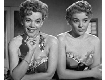
1952 LES AMOUREUX (Las Cariñosas) de Fernando Cortés avec Amalia Aguilar