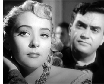
1952 POR ELLAS AUNQUE MAL PAGUEN de Juan Bustillo Oro avec Angel Infante