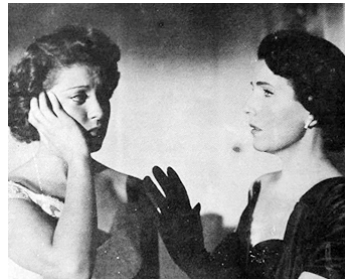
1954 SI TU ME REVENAIS (Volvieras a mi) d'Alfredo B. Crevenna avec Libertad Lamarque