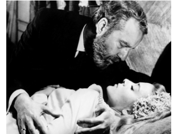
1961 VIRIDIANA (Viridiana) de Luis Buñuel avec Fernando Rey