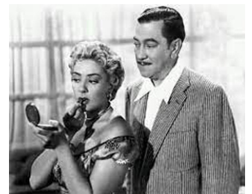
1955 FOLIE PASSIONNELLE (Locura pasional) de T. Demicheli avec Carlos Lopez Moctezuma