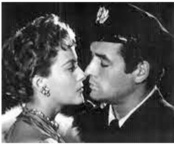
1957 CAP HORN (Cabo de Hornos) de Tito Davison avec Jorge Mistral