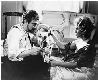
1962 L'ANGE EXTERMINATEUR (El ángel exterminator) de L. Buñuel avec Augusto Benéfico