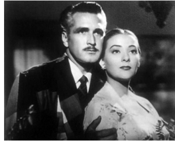
1951 LA STATUE VIVANTE (La Estatua de Carne) de Chano Urueta avec Miguel Torruco